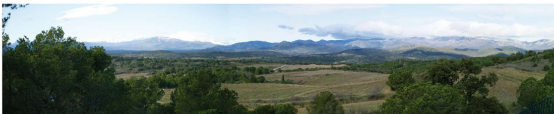
Unitat del paisatge