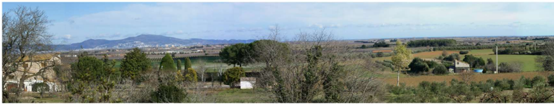
Unitat del paisatge