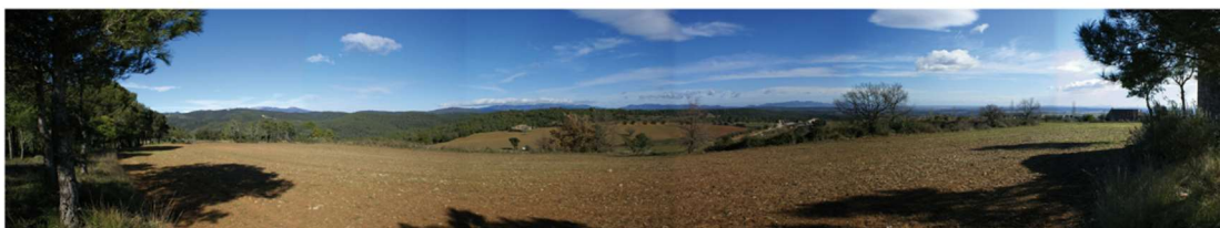
Unitat del paisatge