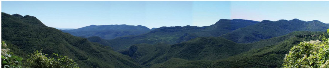
Unitat del paisatge