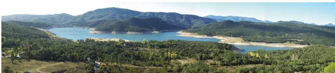
Unitat del paisatge